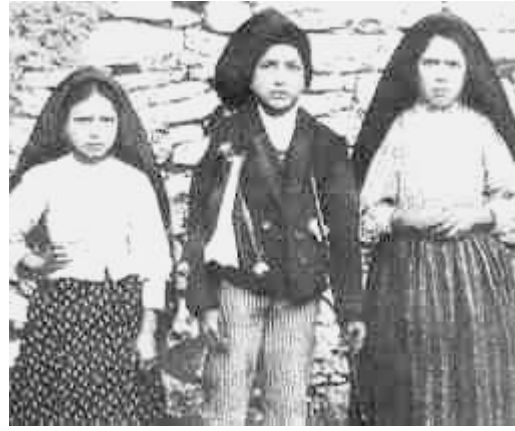
Los tres pequeños

La mañana del 13 de julio, cuando los tres niños llegaron a Cova da Iria, encontraron que los esperaban al menos dos mil personas. La Virgen se apareció a mediodía y repitió su invitación a la penitencia y a la oración. Solicitada por sus padres, Lucía tuvo el valor de preguntarle a la Señora quién era; y se atrevió a pedirle que hiciera un milagro que todos pudieran ver. Y la Señora prometió que en octubre diría quién era y lo que quería y añadió que haría un milagro que todos pudieran ver y que los haría creer.